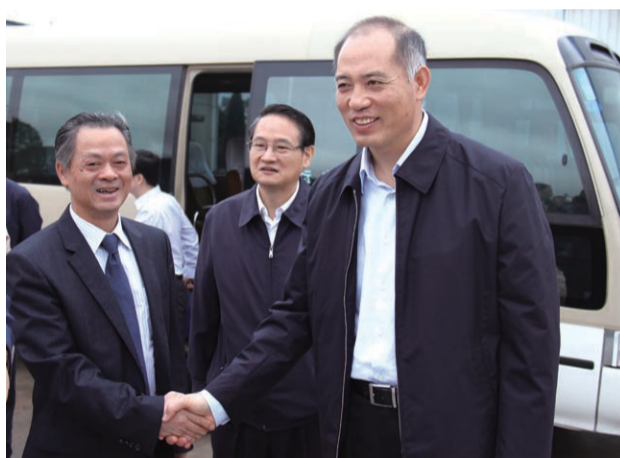
■ 湖南省委常委、省委组织部部长郭开朗（右一）与宇环数控董事长许世雄亲切握手

9月19日上午，湖南省委常委、省委组织部部长郭开朗，省委常委、长沙市委书记易炼红等省市领导一行在浏阳市委书记曹立军的陪同下来到此次浏阳调研考察的第一站——宇环数控，就高层次人才创新创业体制机制建设情况进行专题调研。长沙市委常委、组织部部长程水泉等领导一同参加调研。